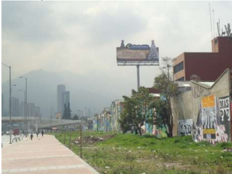
VISTA OESTE-ESTE RESOLUCION 4729 DE 09/08/2011